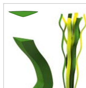
Épaisseur de fibre : env. 250 µm